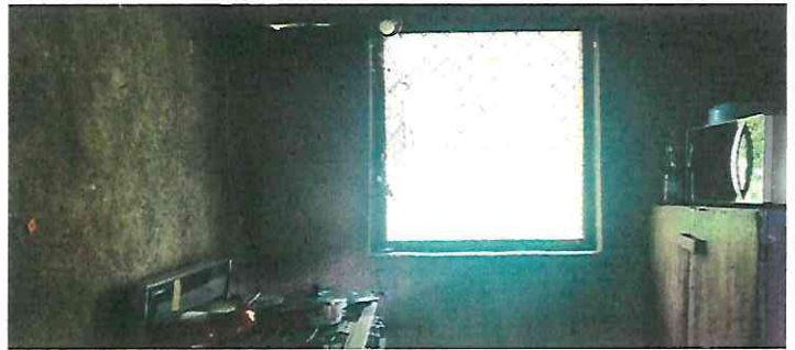
Casa Cocina Cuartos