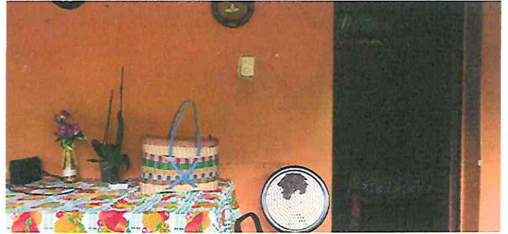
Casa Exterior Patio